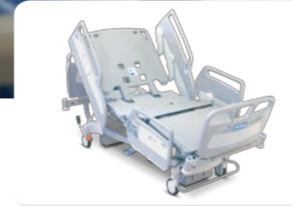
Cama AvantGuard® 1600