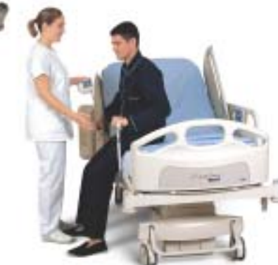
Ayudas para el cambio de posición.