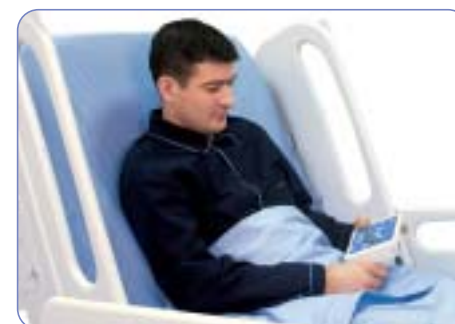
Confort y autonomía para el paciente