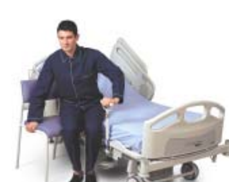
Posición baja de 40cm