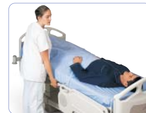
Funciones de emergencia

La cama AvantGuard está equipada con funciones de urgencia por si surgieran complicaciones en el paciente. El asa RCP situada en ambos lados de la cama incluye un descenso amortiguado que baja el respaldo de forma cuidadosa. Una vez activada, la función Shock coloca al paciente en posición horizontal de Trendelenburg. El cabecero es fácilmente extraíble para un acceso inmediato a la cabeza del paciente. Con el sistema central de frenado de la cama AvantGuard, una sola presión del freno basta para bloquear todas las ruedas, lo que maximiza la seguridad del paciente. Para mejorar la seguridad, el pedal de altura variable se desactiva de forma automática cuando finaliza su uso. Todas las características pueden operar sin necesidad de alimentación eléctrica, gracias a una batería de seguridad.