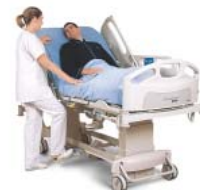
Ajuste de la altura de la cama manos libres.