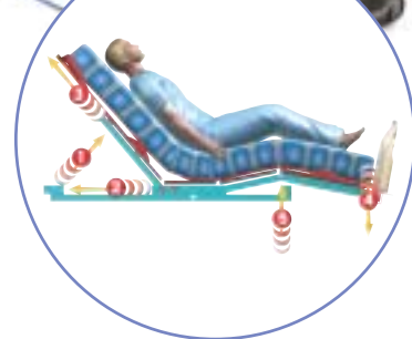
Serie de 5 articulaciones para un posicionamiento óptimo