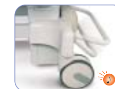
Alarma de freno desactivado