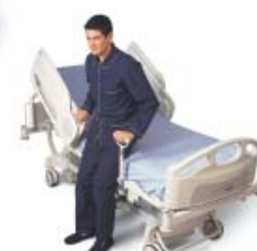
Las barras de salida MobiBar