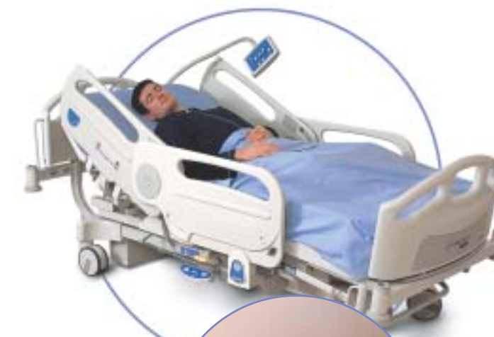
Las barandillas laterales TotalGuard se ajustan de forma automática en una sola acción para fijar una gran variedad de colchones.