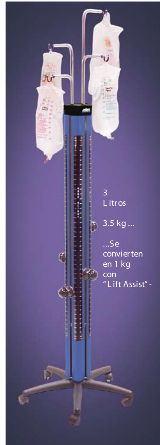
Torre de Irrigación Allen Referencia: O-LPA